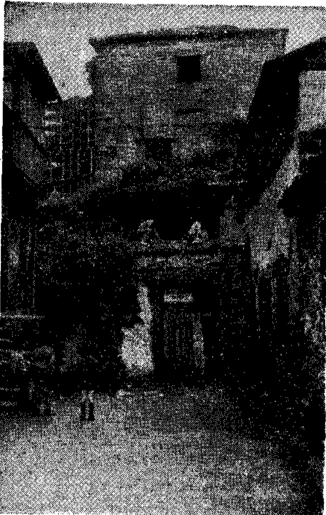
Caserón en ruinas. Un peligro para los vecinos del muelle.

MAÑANA VISITARA LA VILLA EL DELEGADO PROVINCIAL DEL INSTITUTO SOCIAL DE LA MARINA