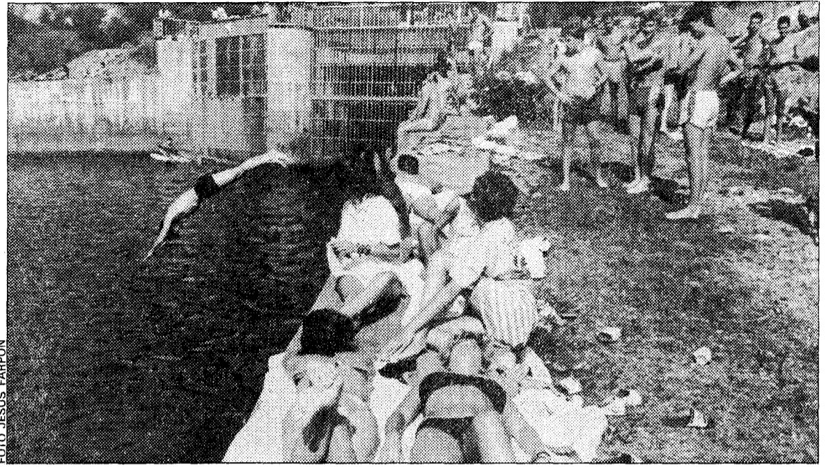
Los vecinos de Rioseco están indignados por la prohibición de baños en el pantano. El lema de las fiestas de este año invita a saltarse esta norma

el segundo día de las fiestas. Los actos más destacados de esta jornada son el IV Circuito ciclista «San Bartolomé», categoría cadete, que dará comienzo a las 4,30 de la tarde, y la carrera de cintas a caballo. A las 10 de la noche la orquesta «Sinfonía», de Avilés amenizará la primera verbena. Mañana, a las 12 del mediodía, se celebrará una misa de campaña con procesión religiosa hasta la iglesia parroquial y, a continuación, habrá un concierto sesión vermouth a cargo de la orquesta «Variedades», de Lugo. La segunda verbena será protagonizada por las orquestas «Expresión», de Oviedo, y «Variedades», de Lugo. El último día de las fiestas del Pote será el