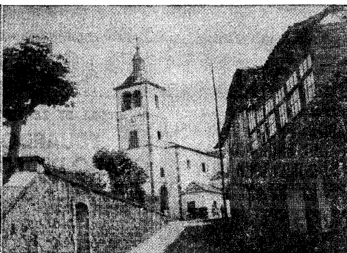
Iglesia de Riberas