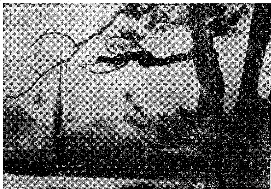
Soto del Barco

A uno se le hace imposible creer que, dentro de este actual mundo de perfecta y planificada ordenación —con derroches de tecnicismo y máximo aprovechamiento de todo recurso natural—, el puerto de «San Esteban-La Arena», dota-