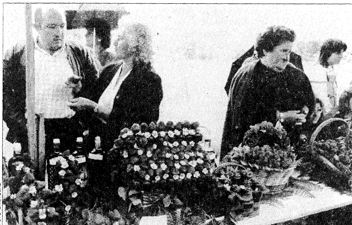
Una casa hecha con fresas, que mereció uno de los premios. En el certamen también cuenta la originalidad

Las fechas que atravesamos, de una cierta transición política en diversas entidades, restó personajes de renombre al festival y sólo concurren mandatarios municipales y locales. Entre ellos, cómo no, el reelegido alcal-