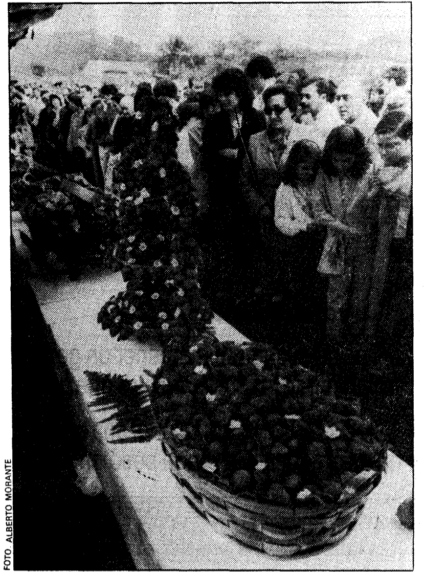
Miles de personas observaron los impresionantes cestos de fresas que se expusieron en el festival

El premio a la originalidad se lo llevó el «stand» de la A. de VV. de Aces, que, al igual que otros años, presentó sus fresas en un marco artístico, muy completo y rebosante de folclor astur. Las tartas que las amas de casa de Aces prepararon para vender en el festival les volaron prácticamente de las manos y es que, además de venderlas baratas,