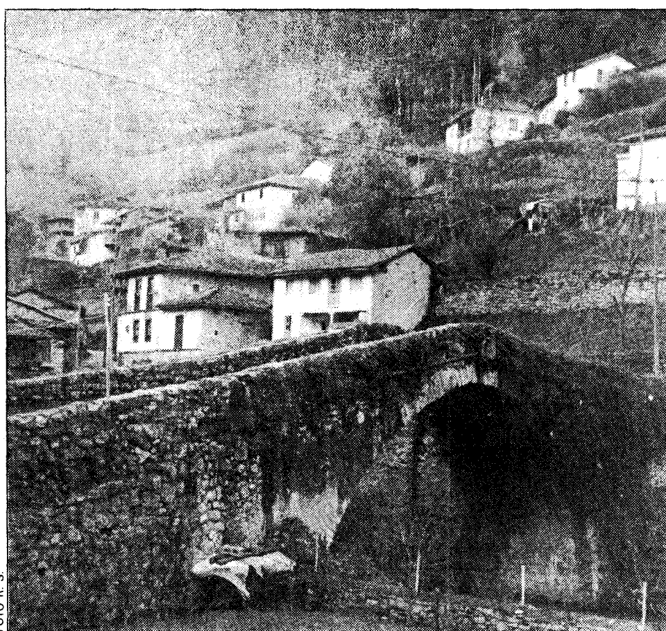
El plano indica la situación de San Adriano, motivo del enfrentamiento entre Grado y Santo Adriano. En la fotografía, vista parcial de esta localidad

Los dos municipios pleitarán sobre la propiedad de un monte de gran valor