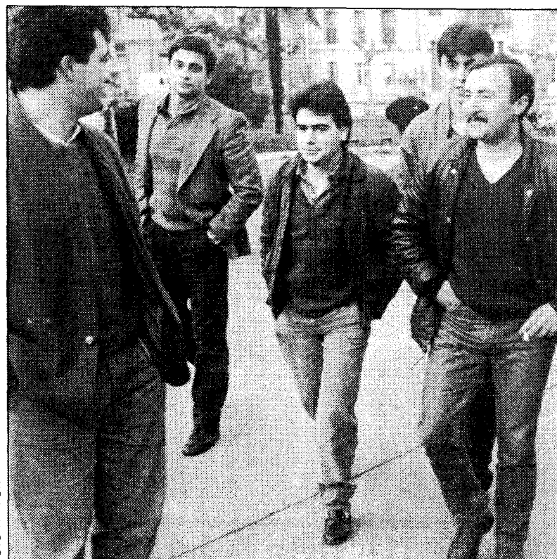
Los jóvenes de Sotrongio tendrán hoy la posibilidad de plantear su problemática

Los jóvenes de Sotrongio no estaban informados, hasta ayer, de ese acuerdo que les brinda posibilidades, aunque es obvio que la fórmula no permitirá la entrada de todos los solteros.