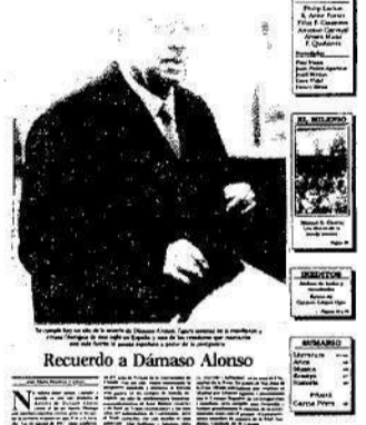
Recuerdo a Dámaso Alonso