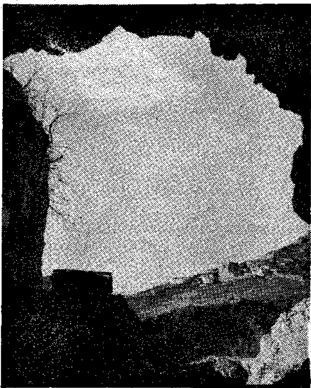
Fresnedo, pueblo típico de Tevera.

(De nuestro corresponsal en Trubia, Caligo).