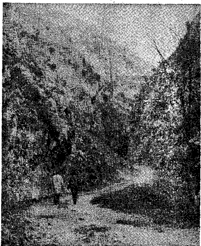
Subida al manantial de «Las Xanas» en el concejo de Villanueva de Santo Adriano.

Es Tuñón el primer pueblo del concejo de Villanueva de Santo Adriano y en él