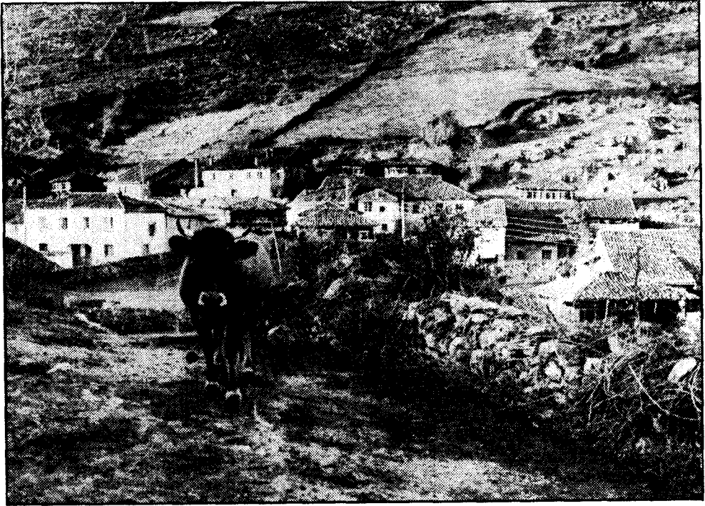
La ganadería es la principal fuente de recursos del pueblo

sobre la muerte, el renacimiento universal. En el alumbramiento, las fuerzas de la noche y de la luz combaten entre sí, y los pueblos, en medio de sus soterradas luchas, buscan la liberación una noche bajo los impulsos de la orgía y de la ebriedad, intentando ser libres como bacantes, enterrando los hombres al año viejo orgiásticamente y colectivamente, casi como si la bacanal, la fiesta desbordada, les purificara ante el nacimiento del nuevo año.