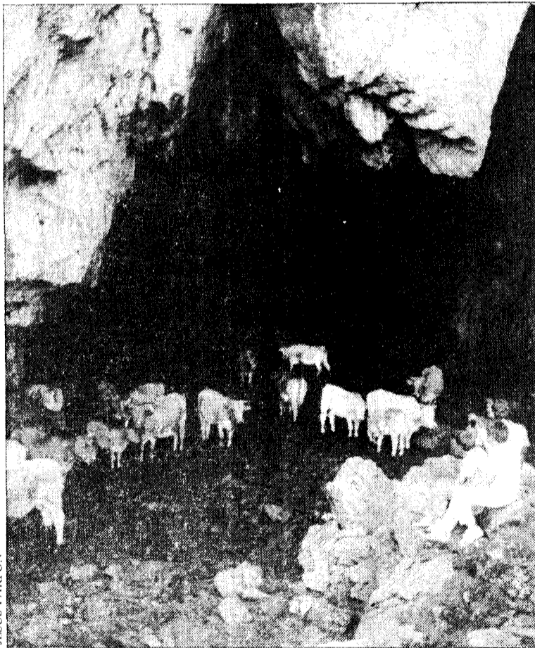
La cueva que da nombre a las praderías donde se celebra la feria sirve de refugio al ganado de la zona.