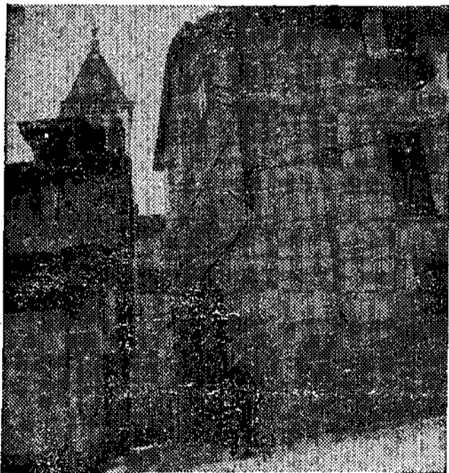
Una esquina típica del barrio viejo de Grado

ALMACENES Al Pelayo PRESTIGIO Y ECONOMIA