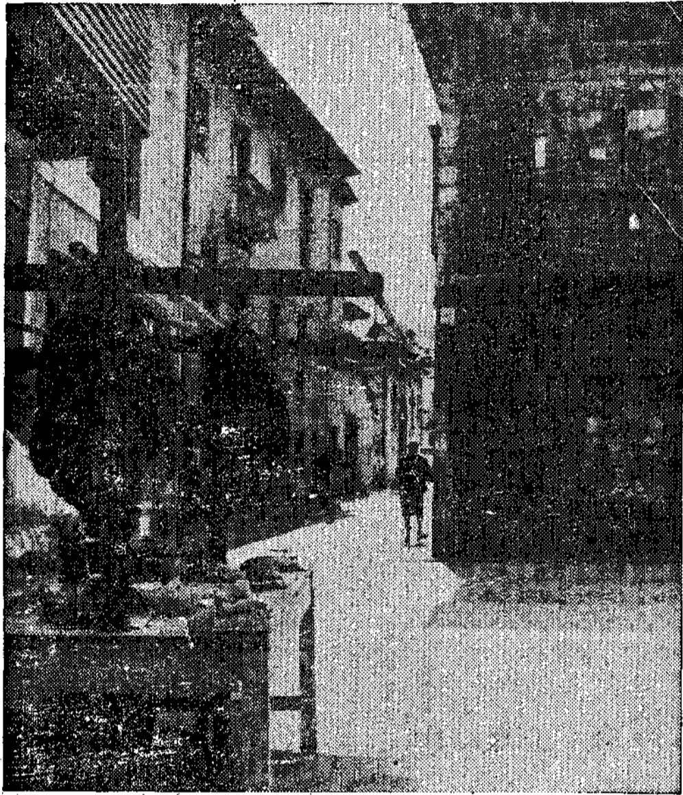
Bello rincón de la plaza del Mercado de la villa moscona

Un grupo de hombres jóvenes trata de aglutinar los hasta ahora dispersos esfuerzos culturales y recreativos