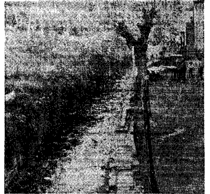
Arroyo de Triana: limpiar y desratizar, dos trabajos imprescindibles.

El Ayuntamiento de Langreo, que recientemente efec-