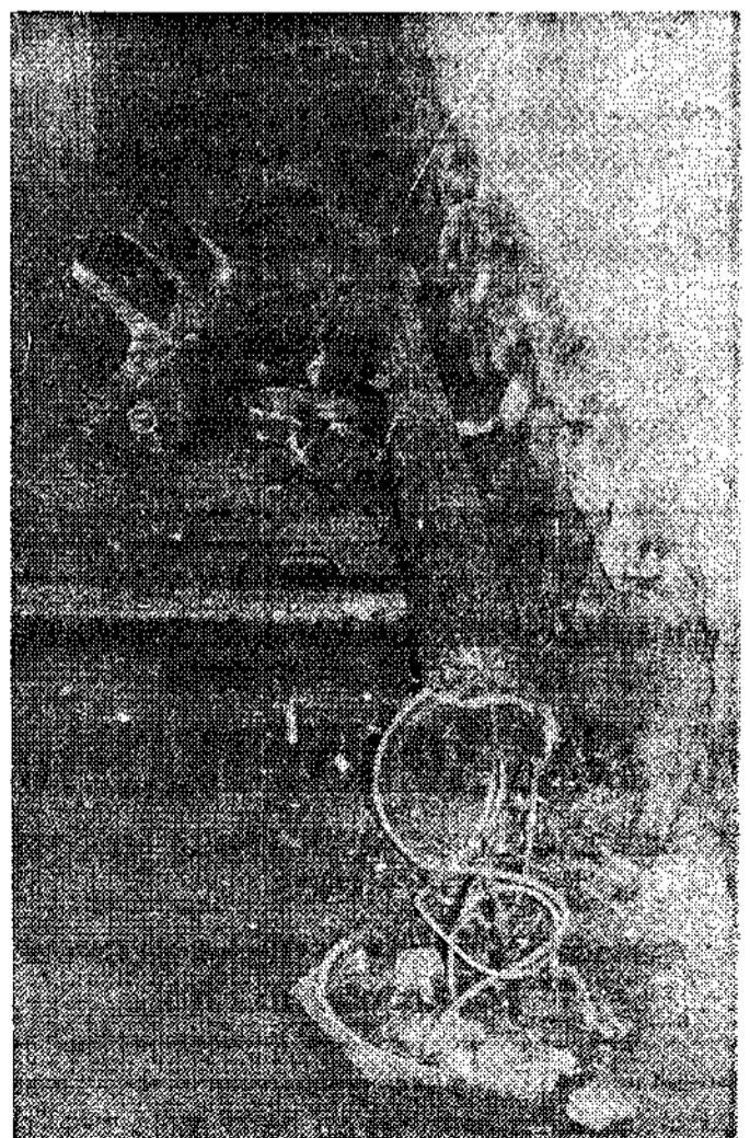
Un camión de Llanera, en la madrugada de ayer viernes, tronchó uno de los semáforos existentes en el cruce Generalísimo-Isabel la Católica. Sin duda alguna el camión de Llanera sabe que en Langreo tenemos algo de fobia a los semáforos...