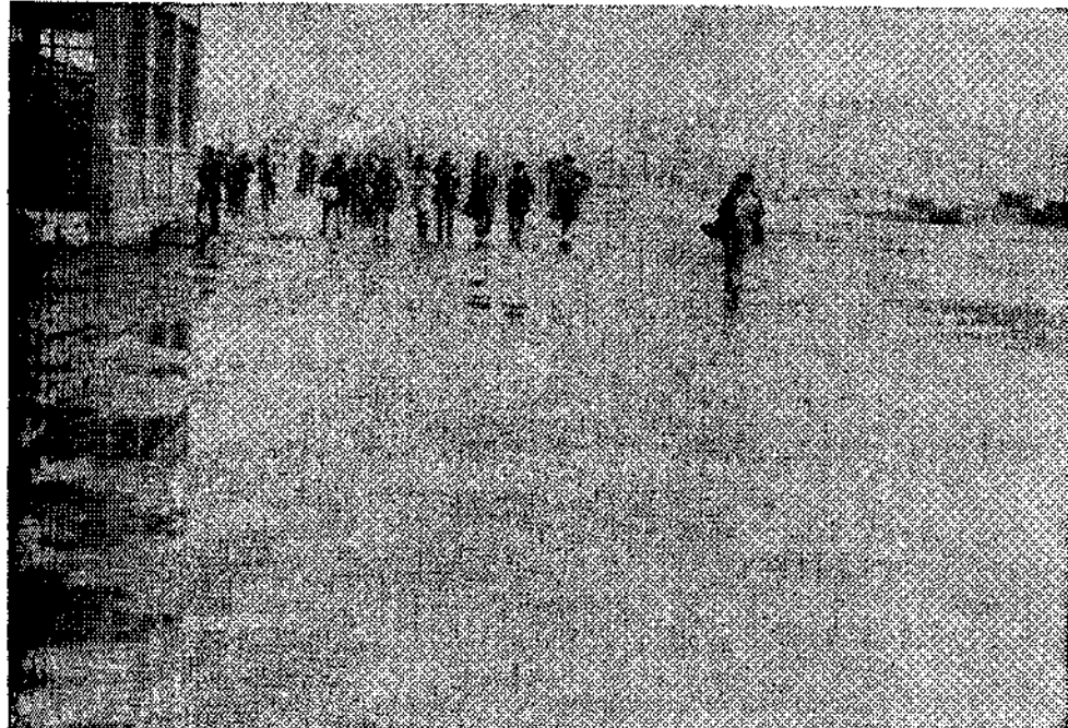
Sama.—En la zona escolar de Los Llerones ir á el colegio de enseñanza general básica. Falta elegir los terrenos en La Felguera. (Foto ORTEGA).

LA CORPORACION CEDERA LOS TERRENOS: EN SAMA, LOS LLERONES; EN LA FELGUERA SERAN ADQUIRIDOS