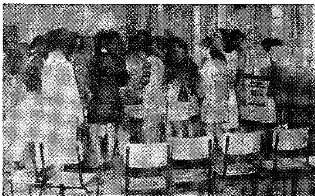
Ciaño.—Fue clausurado otro curso de promoción de la mujer. Una interesante iniciativa del PPO y HUNOSA. (Foto ORTEGA).

PARA ESPOSAS E HIJAS DE PRODUCTORES DE HUNOSA