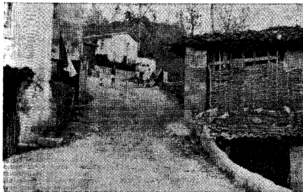
Caminos vecinales: una tarea que es preciso acometer con entusiasmo, a fin de ilusionar a los vecinos de los pueblos altos.-(Foto Ortega)

Carreteras a las zonas altas: una inquietud permanente