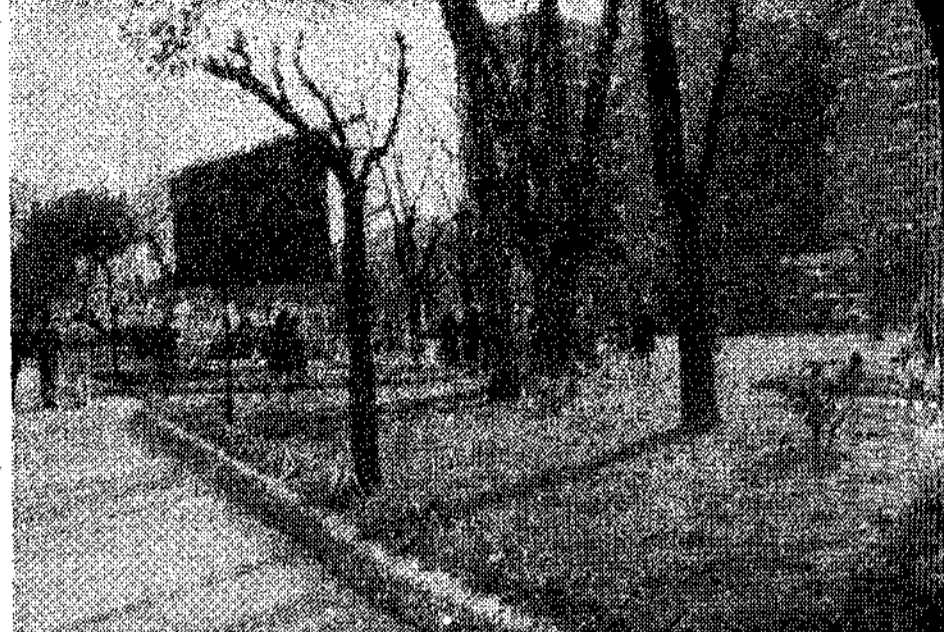
Pintura y adecentamiento de parques: he ahí una tarea para las próximas semanas en el concejo.

La delegación en Langreo de la Asociación de Amas de Casa "Virgen de Covadonga", ha enviado un escrito a la Corporación municipal exponiendo dos problemas de la barriada de Lada: de un lado, ausencia de vigilancia, y de otro la carencia de carboneras. Sobre este segundo tema, nuestro periódico ha recogido, en múltiples ocasiones, su incidencia en la estética y urbanismo de la zona, totalmente deplorable y las fotografías de nuestro compañero Ortega han evitado las palabras: la imagen es harto expresiva para tomar en consideración esta preocupación de las amas de casa que hacemos nuestra, solicitando del Ministerio de la Vivienda una solución a este problema.