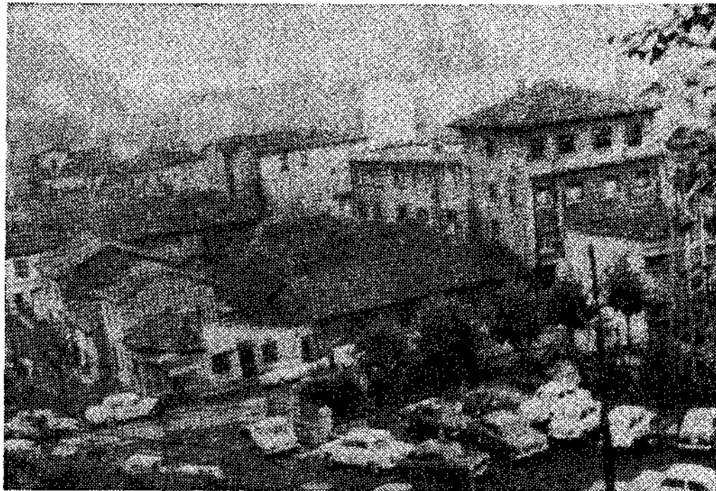
El problema de los aparcamientos en el cementerio de Sama es grave: como no existen, en días de afluencia al camposanto, hay que aparcar a más de 300 metros, invadiendo instalaciones de HUNOSA.