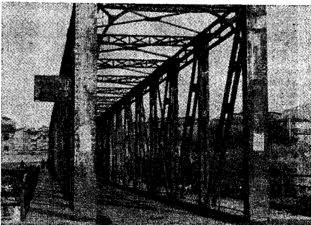
Puente sobre el Nalón en Lada: una renovación imprescindible.

Lo que puede llegar a ser un atractivo de primera magnitud para futuras ocasiones, es decir, este concurso de música folk está teniendo en esta su primera ronda un gran éxito de participantes por lo que la velada-concurso que tendrá lugar en el salón de actos del polideportivo local el día 17, a las ocho de la tarde, promete estar a las de entreteñida y disputada. Es un nuevo punto que añadir a la serie de aciertos que la actual junta de sociedad está teniendo en la presente edición.