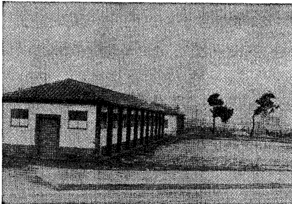
La ordenación de esta zona del Fondón originó en el Pleno «contraste de pareceres». El tema exige amplia meditación.

Langreo. — (De nuestros corresponsales, LOPEZ y LLANA).