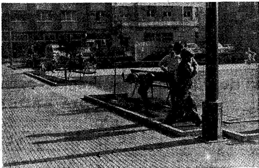
¿Tienen estos niños conciencia del perjuicio ciudadano que están ocasionando? Los padres y educadores, creemos, sin embargo, que son los principales responsables de estas deprecaciones infantiles.