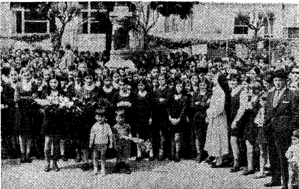
¿Ha desaparecido este homenaje floral a Dorado, fundador del parque de Sama? Los síntomas son significativos al desaparecer los hombres que lo organizaban.

Sábado, día 17, por la tarde, recogida de papel: periódicos y revistas atrasadas, organizada por Caritas diocesana para la promoción gitana.