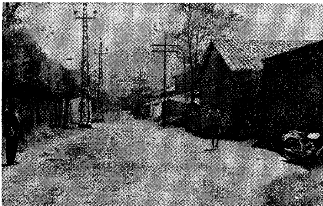
Circulando por este acceso, ahora sin vía, los peatones se libran de los peligros de la carretera general.

Ha desaparecido la línea del ferrocarril de la empresa UNINSA frente al sanatorio Adaro de Sama, que llega hasta el paso a nivel de la RENFE en Ciaño: en el futuro urbanístico aquí irá una calle más ahora puede ser un acceso para peatones de mucha utilidad por cuanto circular por la carretera general es una firme oposición a llevar la ropa a la lavandería; en días