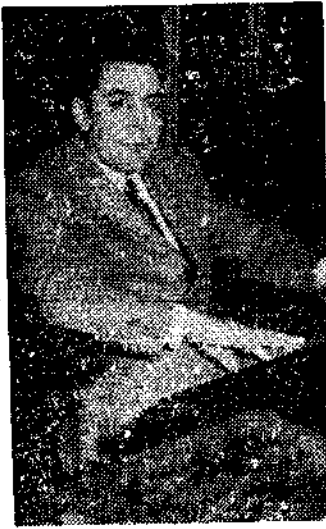
Problema UNINSA-Felguera, y Enseñanza.

El orden no indica ninguna personal estimación de la escala de valores, tan sólo que de alguna manera hemos de reseñarlos.