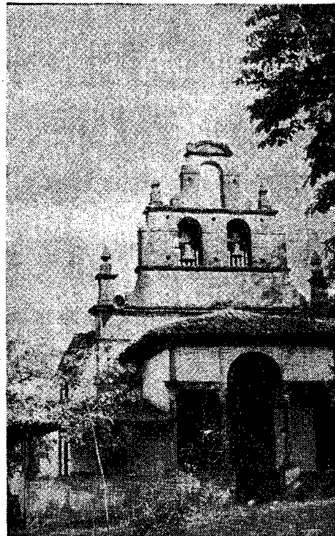
La ermita de la Patrona de Langreo, en El Carbayo, sigue siendo motivo de atención. Las obras van a buen ritmo, pero con la fiesta cercana se pide atención a otros aspectos de indudable interés.

Según nos comunica el señor Velasco, miembro de la junta, que con frecuencia sube al Carbayo, para aten-