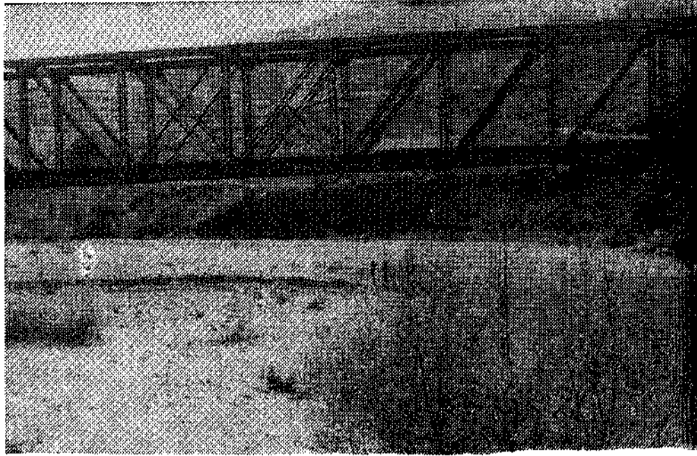
En esta llera, bajo el puente de Gallegos, podía hacerse una playa fluvial con poco dinero.

En su día se solicitó la intervención de la Comisión Provincial de Servicios Técnicos, sin que hasta el presente se tengan noticias ni de estudios ni de proyectos que pongan remedio a la situación.