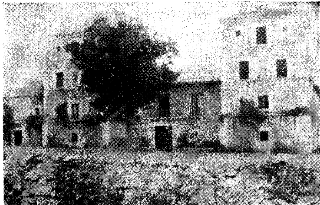
Palacio de Villanueva, San Cucuao.