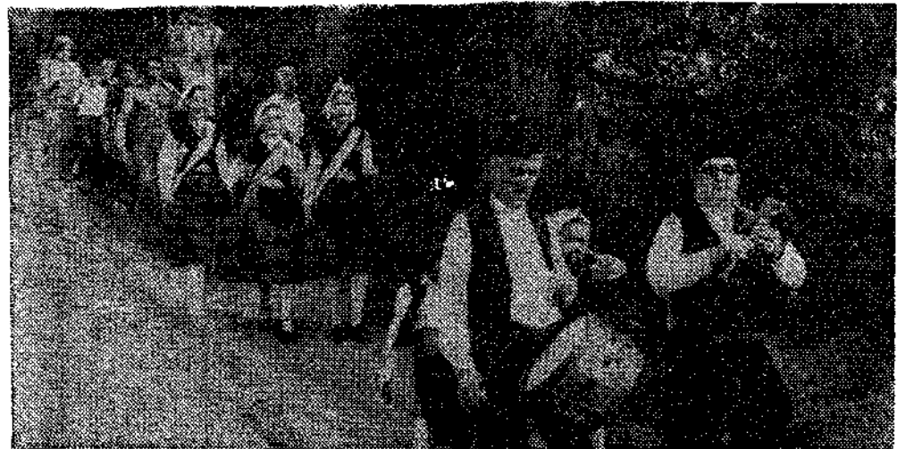
El «ramu» de ofrenda sale portado por mozos de Insierto, precedidos de las xanas y gaiteros, hacia el santuario.

Este diminutivo lo aplicó el pueblo de Insierto al no poder disfrutar de la gran romería como directos anfitriones de la del «27». Por eso