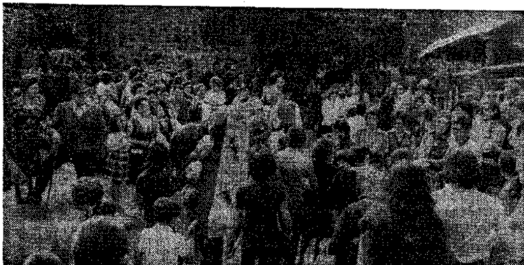
El «ramu» llega a la capilla de los Mártires.