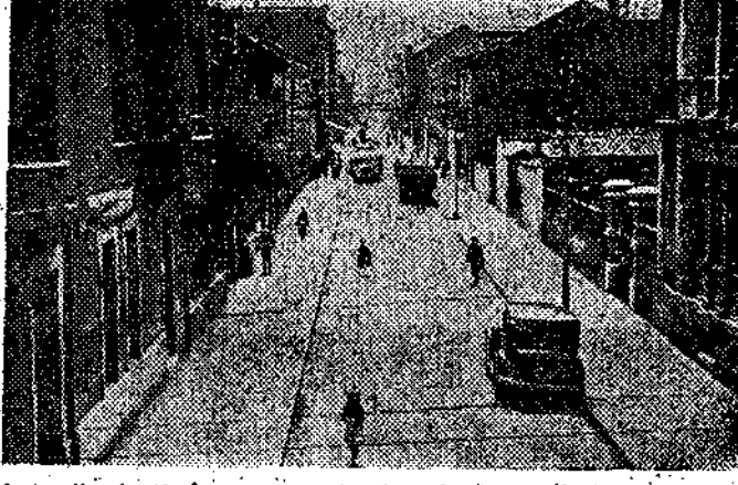
La calle J. Ibrán, y a su fondo, el signo admirativo de la enorme chimenea del Barredo.