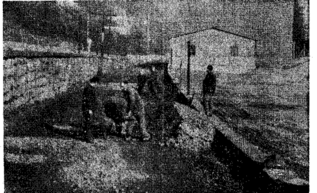
Obras de acceso a El Requixau