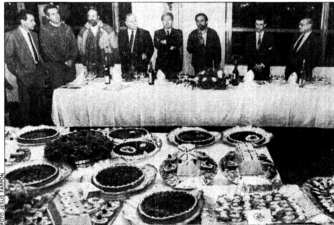
El certamen de «afuega'l pitu», presentado anoche en Oviedo

Por otra parte, en una asamblea celebrada ayer, la Asociación Profesional de Facultativos decidió presentarse a las elecciones que para la formación de la junta técnico-asistencial del hospital se celebrarán el próximo día 22. La asociación, que en los pasados comicios sindicales del Insalud propugnaron la abstención, basa ahora su cambio de actitud «en la necesidad de plantear la batalla desde dentro, aunque mantenemos el no acceder a las comisiones de control de calidad». La candidatura que la asociación presentará, será elaborada, previsiblemente, en el transcurso de esta semana.