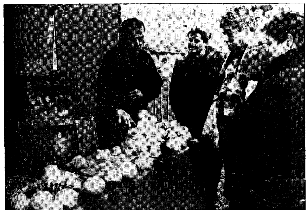
El interés por el queso, en todas sus variedades, «blancu o roxu del trapu» y «atroncau» fue muy grande. Una de las novedades de este año fueron los stands

El certamen de La Foz puso de manifiesto la necesidad de crear una red de distribución de este típico producto artesano