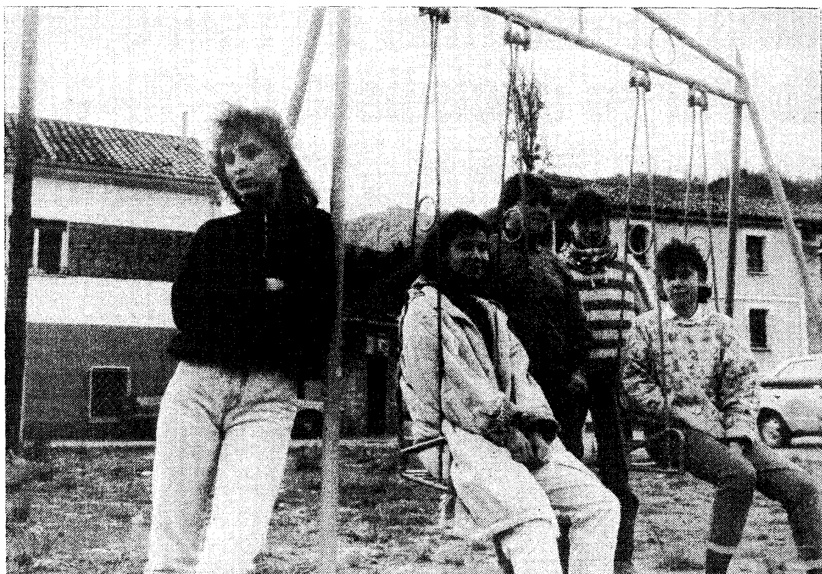
Varios jóvenes de Morcín junto a unos columpios en Santa Eulalia. Pese al desarrollo que se prevé para su pueblo, ellos reivindican un polideportivo.

Degaña, Ribera de Arriba, Morcín, Navia y Oviedo, los más destacados