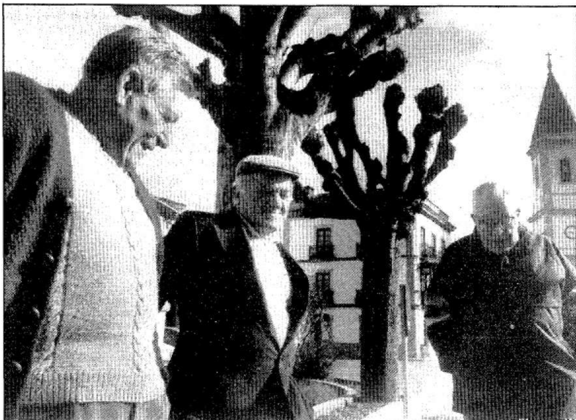
Las obras de construcción del nuevo paseo de San Esteban de Pravia comenzarán próximamente. A la derecha, unos vecinos de Muros de Nalón dan diversas sugerencias sobre la remodelación de la plaza local.