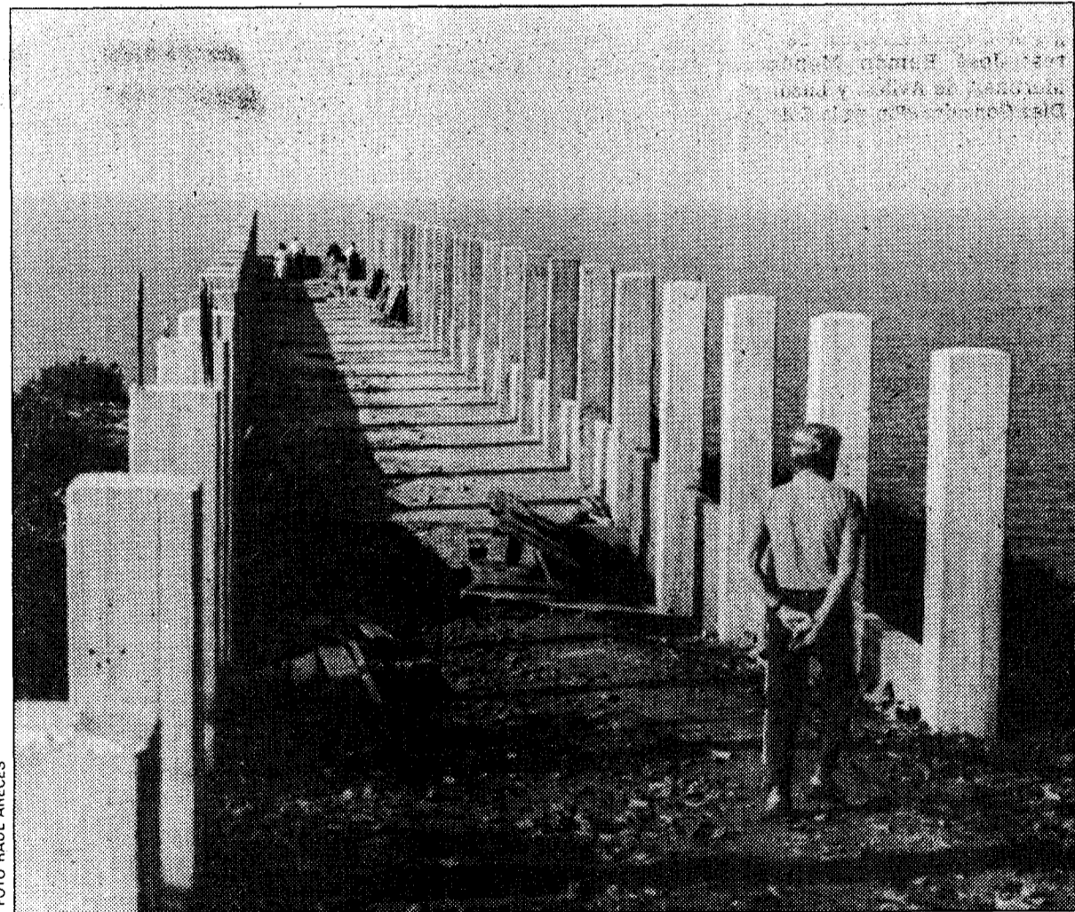
El alcalde de Muros de Nalón asegura que cuando el mirador quede cubierto por la vegetación que se sembrará no se notará su particular aspecto.

La obra comenzó el pasado año y hubo de ser paralizada y adjudicada a un nuevo contratista. La opinión pública local se