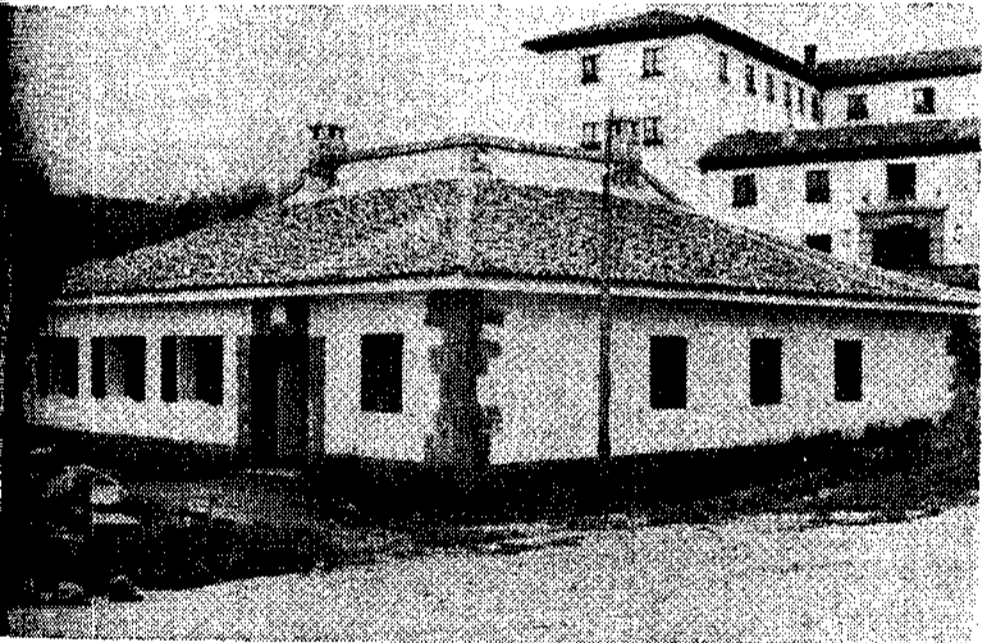
Casa de la Juventud

preferimos hacerlo más ameno, resumiendo las actividades que vienen desarrollando y las que prevén hacer de inmediato.