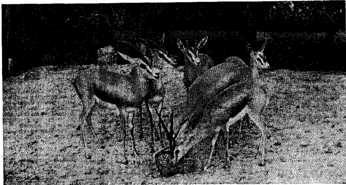
La colonia saharauí, en Asturias

un macho de tres años y dos hembras algo mayores. La descendencia tiene seis y cuatro meses. --¿Es difícil su reproducción? --Parecen dos veces al año, una sola cría. En casos de agua que han de encontrar aquí. Respecto a alimentos sólidos, les va muy bien con alfalfa, heno y piensos compuestos. --¿Considera, por tanto, fácil su aclimatación? --Fácil, de ninguna manera.