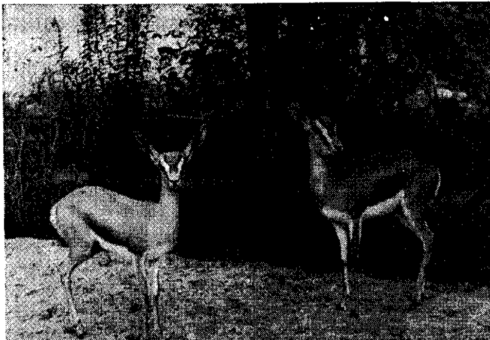
La gacela llanisca, con su madre