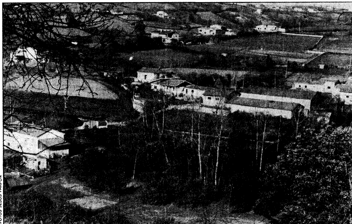
Vista de La Felguera de Celles. Ríos y caleyas marcan sus límites con el concejo de Siero

Aunque son «unos pocos días de gües» desgajados del resto del municipio, sus habitantes se siguen sintiendo noreñenses y no quieren saber nada de pertenecer a Siero