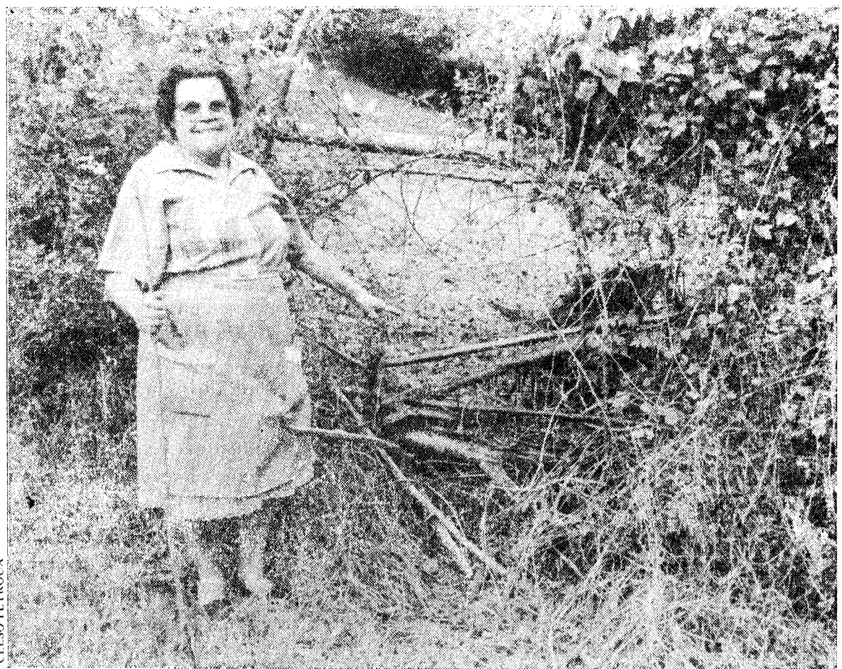
Una vecina de Caranga muestra la «furaquera» por donde entran los venados.

Los venados de la zona de caza mayor de Caranga, en el concejo de Proaza, siguen causando importantes destrozos en los cultivos y árboles frutales en las fincas privadas de los alrededores del pueblo. Manzanos y avellanos, sobre todo, son víctimas de los ataques nocturnos de los cérvidos que,