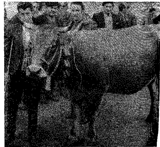
Novilla del país. Su precio: 56.000