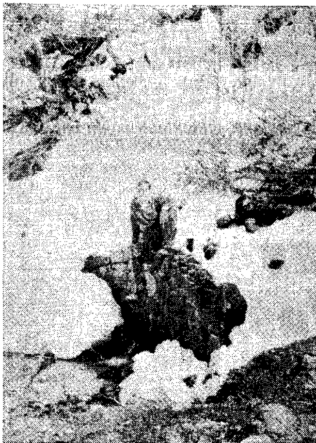
La «Fuente de La Nalona»