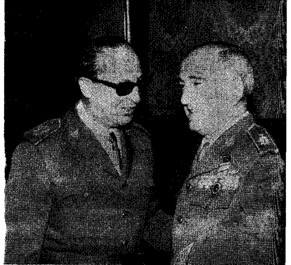
El director general de la Guardia Civil, el asturiano teniente general Díez Alegría, conversa con el gobernador militar de Oviedo