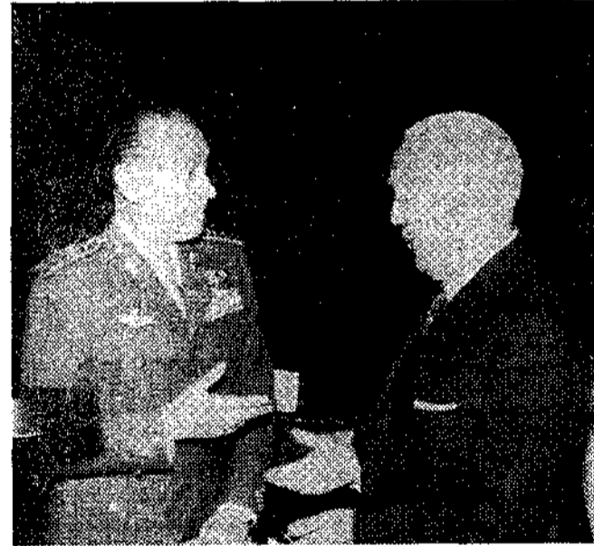
El capitán general de la VII Región, teniente general Ruiz-Fornells Ruiz, con el ministro de la Gobernación, teniente general Alonso Vega

Sanidad, Comunicaciones y hasta la fuerza gubernativa, pero nunca los Municipios, que en España forman familia de cuatro mil. Por eso, este título de uno de ellos al ministro de la Gobernación significaba para él un regalo que entrega un hijo al padre de una familia numerosa. Lo guardo en mi corazón, dijo, con emoción y cariño. Y con emoción, y por aquello, señaló, de que las cri-