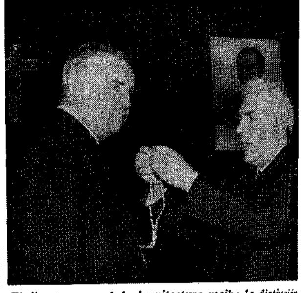
El director general de Arquitectura recibe la distinción de manos del alcalde