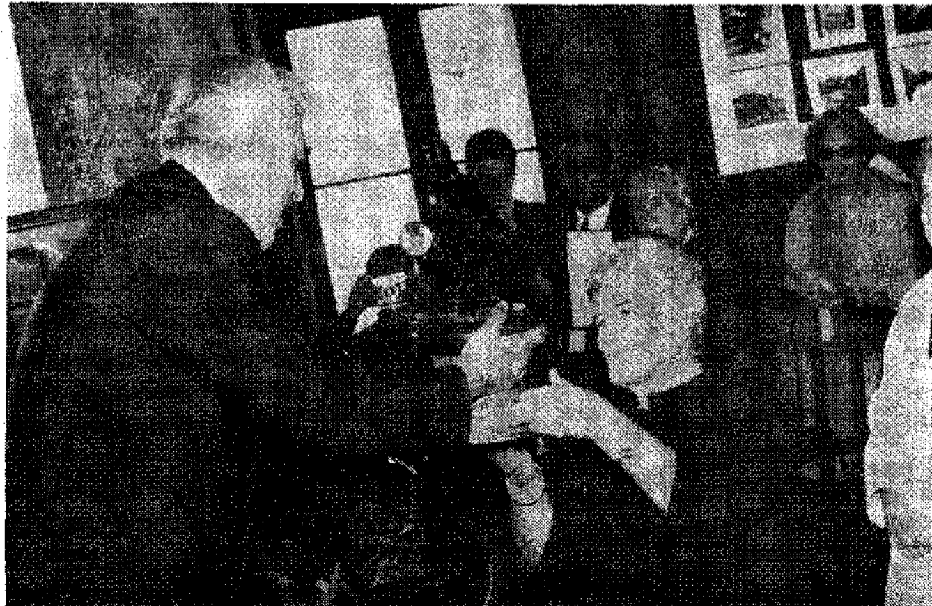
También hubo una distinción para la esposa del ministro de la Gobernación