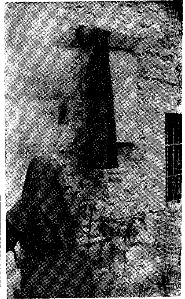
Descubrimiento de la placa que recuerda el día de ay