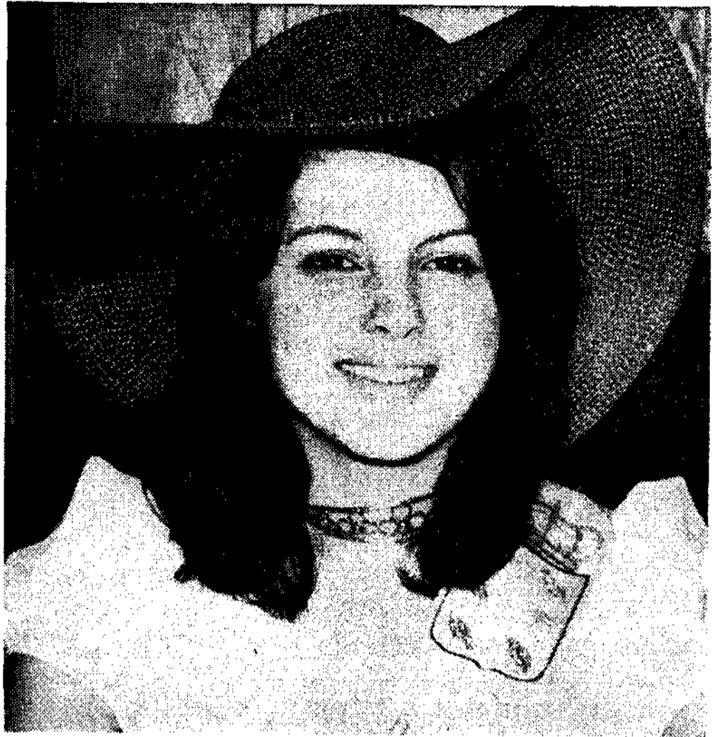
La reina del festival.

Carlos RODRIGUEZ y Angel Ricardo, enviados especiales