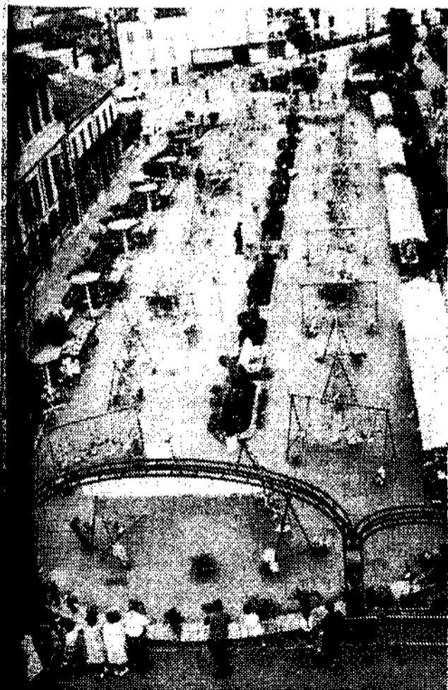
Una vista general de la Exposición.