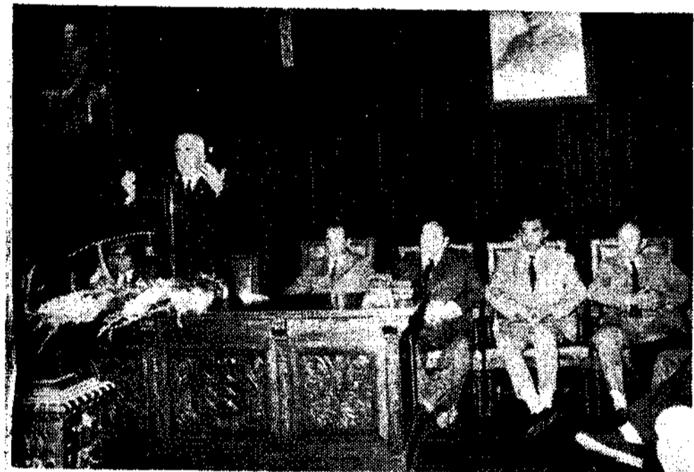
Presidencia del acto de apertura.

En Pravia comenzó ayer el IV Certamen de flores, hortalizas y frutas, que en esta edición amplia su participación a toda la región asturiana, tras tres concursos comarcales en los que tomaban parte los siete concejos de aquella comarca. La organización del Ayuntamiento, de los Servicios Agropecuarios de la Diputación y de la Cámara San-