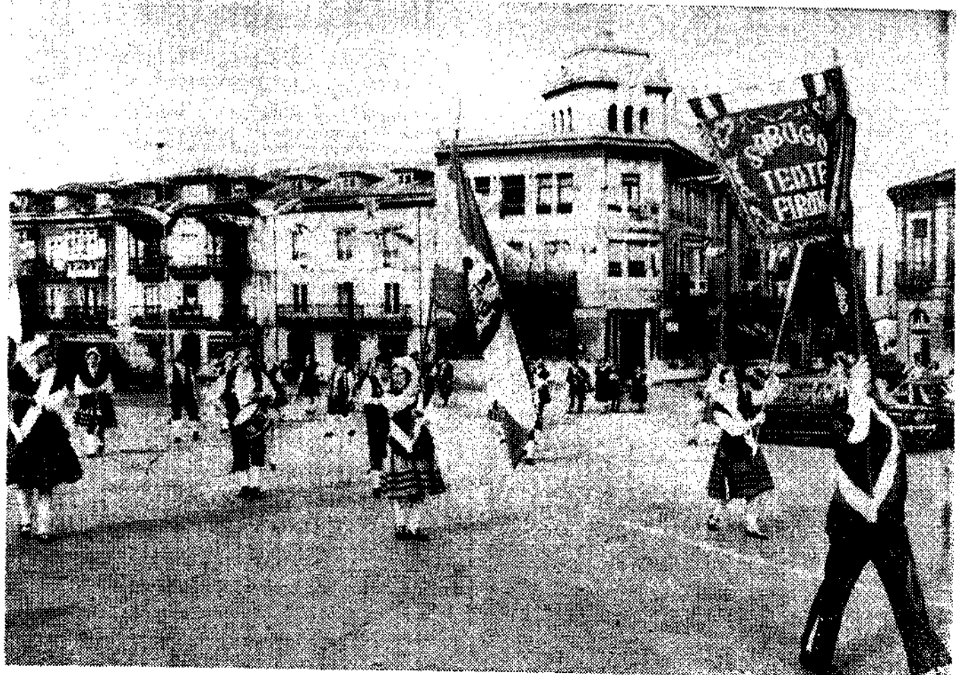
«Sabugo, tente firme», desfilando por las calles de Pravia.