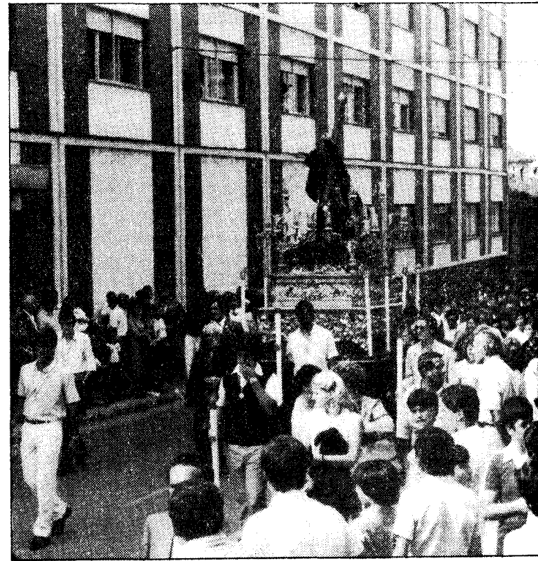
Imagen del Ecce-Homo, en la solemne procesión.

(*) Alcalde presidente del Excmo. Ayuntamiento de Noreña.