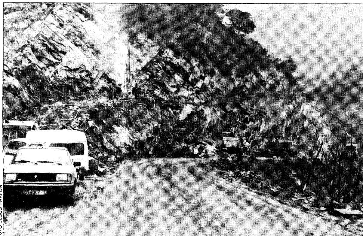
En muchos tramos apenas hay sitio para abrir la caja por el estrecho valle. Para ello hay que excavar la montaña desde la cima hasta la futura calzada

En muchos tramos hay que ganar terreno a la montaña y coser los taludes para que no se desprendan