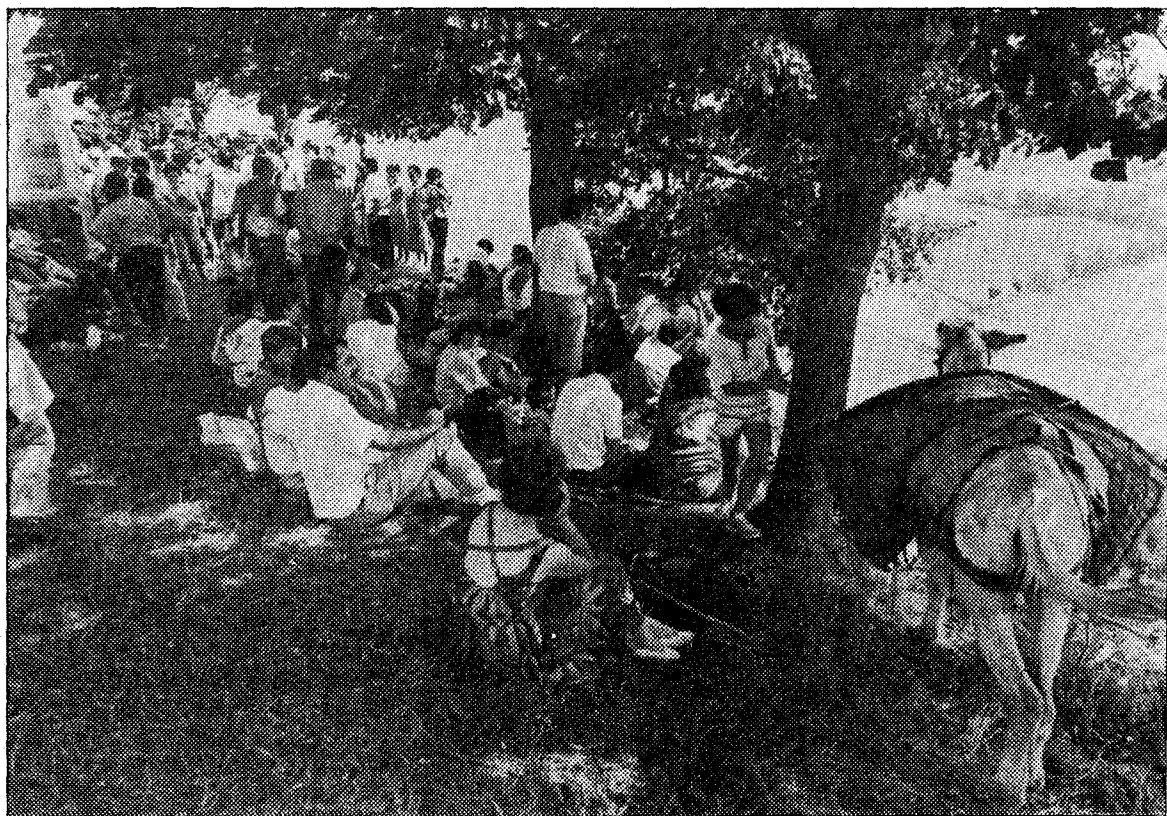
La tradición impone que a la Cuesta Pena hay que subir con burros o caballos, e incluso el día anterior a la fiesta para dormir en el prado