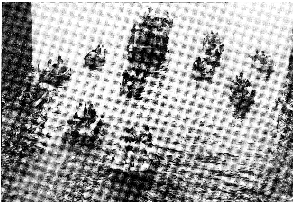
La patrona de Navia volvió ayer a recorrer la ría

Para el día de hoy, festividad de San Roque, los actos más significativos serán la celebración de la fiesta del socio, donde se entregará el bollo y el vino, y la gran regata de lanchas, tercer premio «San Roque», a partir de las siete de la tarde. A las nueve de la noche, fiesta, seguida de verbena, a cargo de las orquestas «Trole» y «Navada». Las fiestas concluyen mañana, lunes, con la celebración de la jira, desde las diez de la mañana, en la playa de Navia. A partir de las ocho de la tarde y para despedir las fiestas, última verbena amenizada por «Trole» y «Los Magos de España». Informa Jorge JARDON.