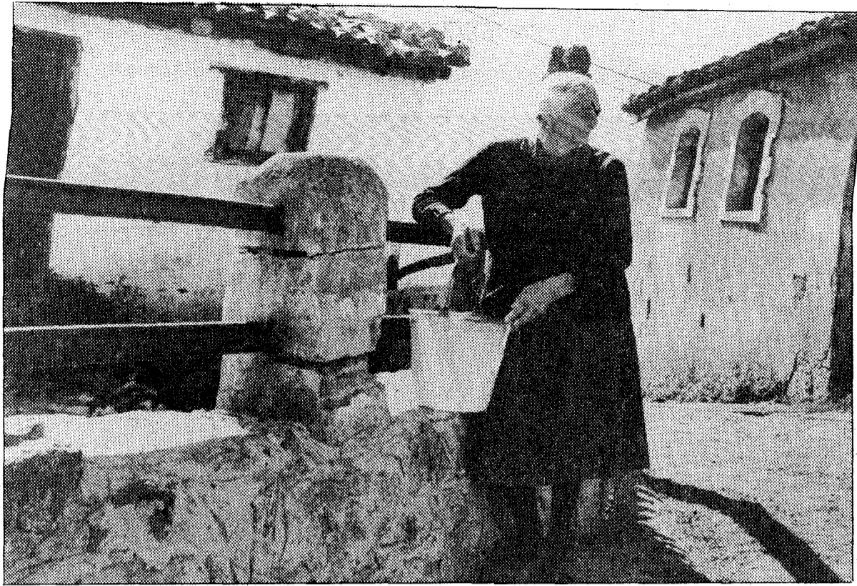
Melchora Alvarez, de 82 años, nunca olvida en las oraciones al patrón de su pueblo

Es una aldea pequeña, en la falda de una montaña, de caminos estrechos y empinados, don-