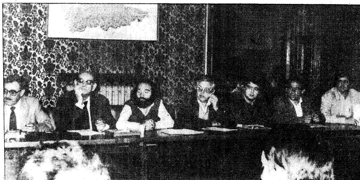
El Grupo Socialista varió su posición de 1983 y decidió la supresión del tres por ciento