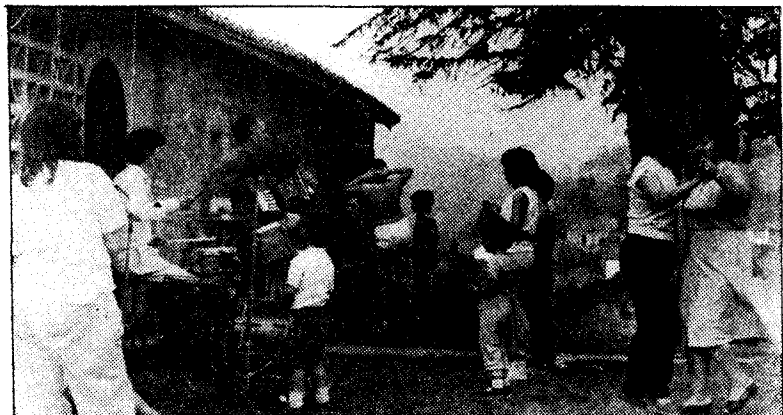
La fiesta de Pedroveya adquirió un sabor tradicional con el batería y el acordeonista que hicieron bailar a toda la concurrencia