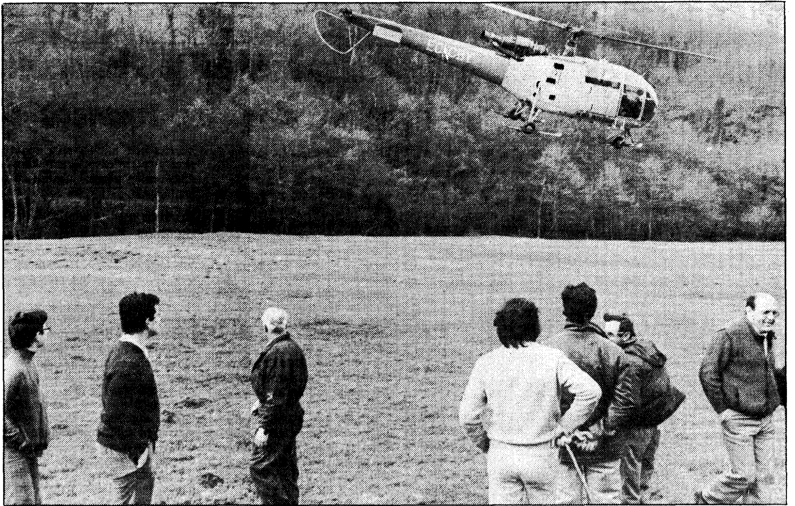
Los vecinos contemplan cómo parte el helicóptero para localizar las yeguas en el monte, a las que luego se les llevaría alimento.