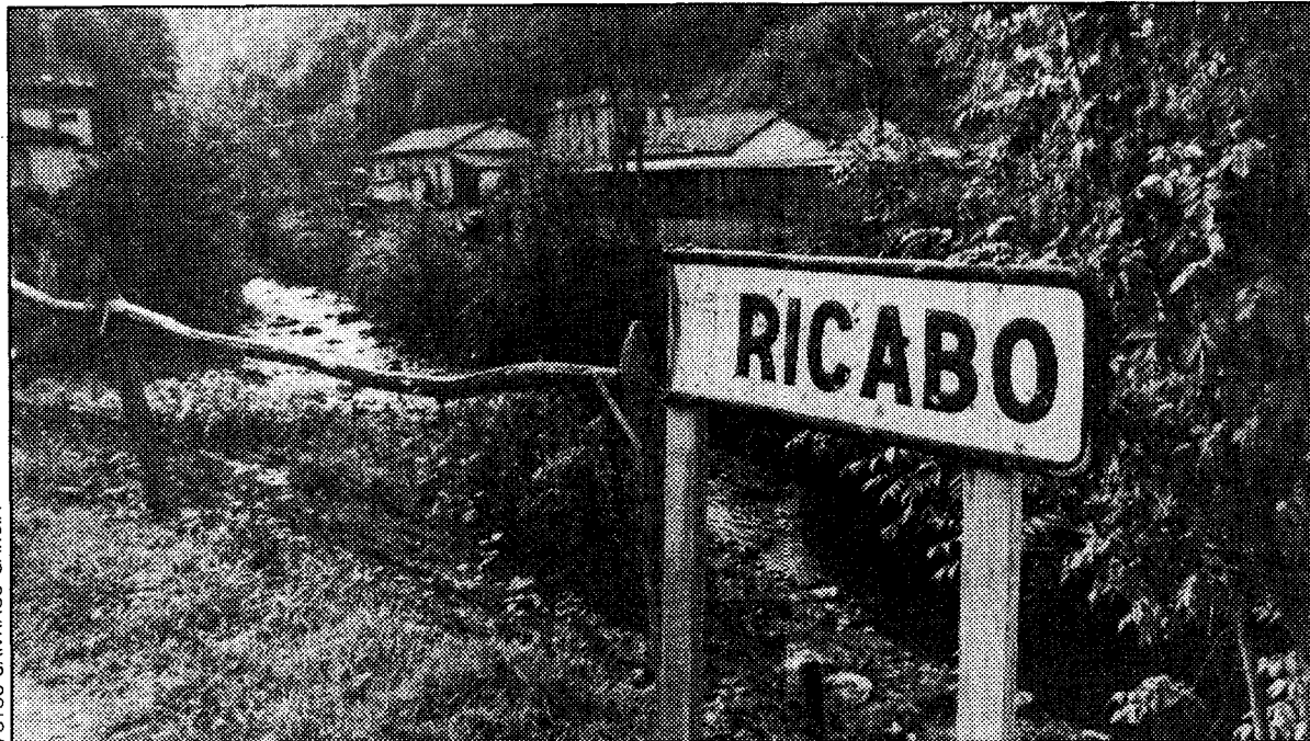
Los ríos Ronderos y Lindes se unen en las cercanías de Ricabo, de donde partirá uno de los canales