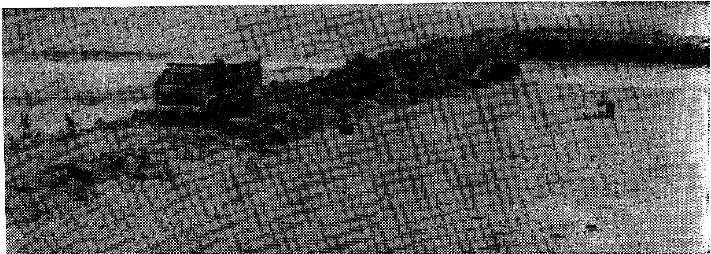
Estado actual de las obras.