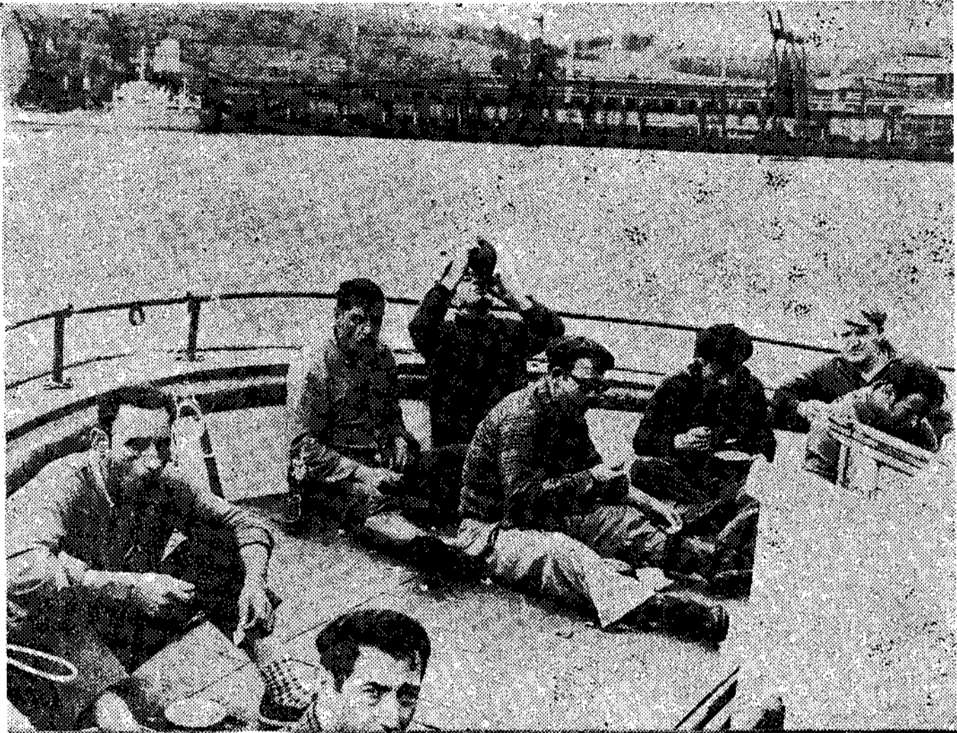
Los pescadores necesitan un puerto más moderno, mayor...

se han continuado los trabajos de mejora de calados y rectificación de cauces en el canal, concretamente en la curva de Pachico, dragándose un volumen de 10.380 metros cúbicos medidos en perfiles, en margas duras; en dragados en dársenas se extrajeron con la draga «Avilés» y su equipo 108.200 metros cúbicos de cántara, y con la draga «Alvargonzález» en dragados igualmente de conservación 157.060 metros cúbicos de cántara, en la barra, canal de Pedro Menéndez y dársenas. Se prosiguen los trabajos de las obras en ensanche del canal de entrada, con un presupuesto de contrata de 479.529.976 pesetas, habiéndose continuado el avance del espigón emergente, pedraplén auxiliar para la hinca de la pantalla de tablestacas como elemento auxiliar en la zona inmediata a las instalaciones industriales. En 1972 se han redactado los proyectos de revisión de gánguil «Sabugo» y