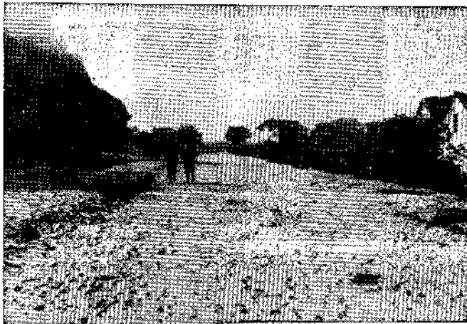
La calle Ronda, cierre de Salinas al pie de la montaña

—Claro, todo esto da lugar a que además de nosotros queden fuera localidades de verano tan importantes como Llanes, que, además, tiene una situación de privilegio por su proximidad en una ruta a la frontera. Llanes podía encajar a los turistas hacia otras zonas de playa y montaña de la provincia.