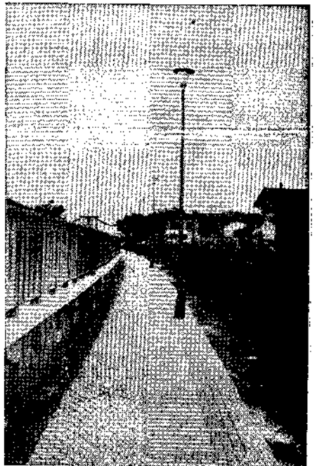
Nuevo alumbrado para una calle nueva