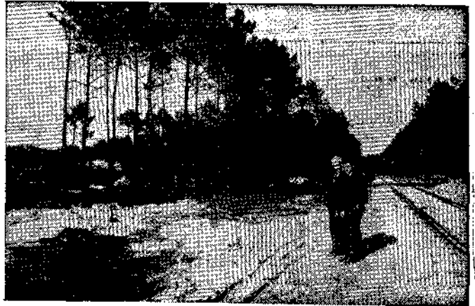
Entre los pinos empieza a delinearse la calle paralela al muro

Veinte mil metros cúbicos de arena es el firme colocado en el primer tramo de construcción de la calle de Ronda. La segunda mitad necesitará una cantidad aproximada, para completar la caja de esta importante vía de Salinas. Tiene, aproximadamente, cuatrocientos metros de longitud desde la carretera general de Piedras Blancas hasta la calle de Franco. Esta será el límite de Salinas por la parte sur.