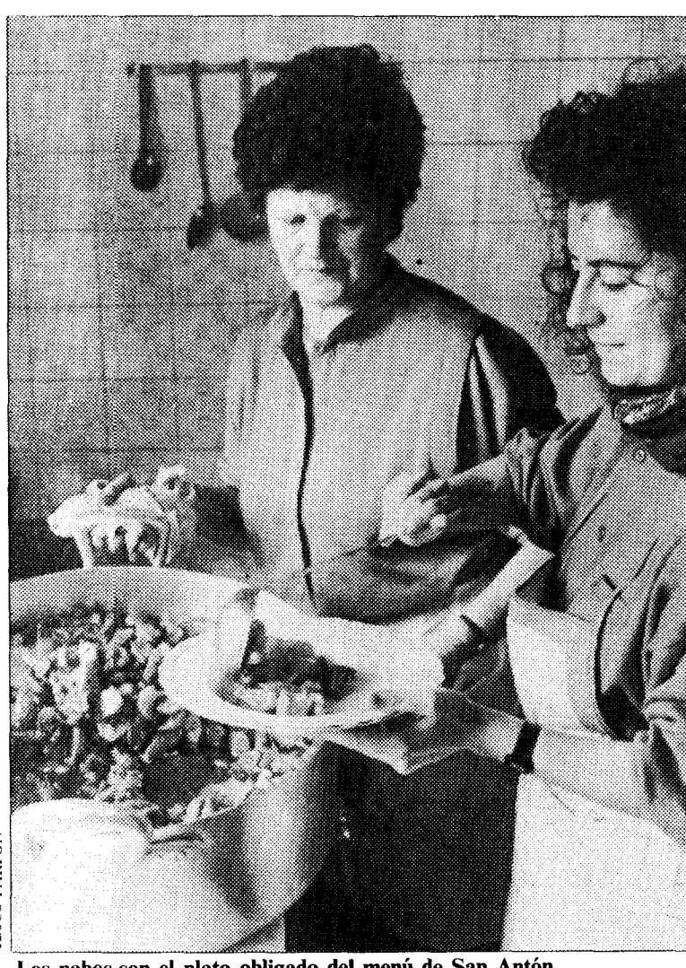
Los nabos son el plato obligado del menú de San Antón.

Los actos, durante la tarde, fueron preferentemente deportivos, para concluir con la actuación del «Ochote La Unión», de Mieres. La atención del público en general también pasó por la exposición de artesanía de autores municipales que se presentó en las dependencias del polideportivo. Asimismo, los alumnos de la primera etapa del colegio público de La Foz expusieron sus dibujos en otra de las dependencias municipales.